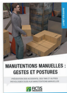
Livret manutentions manuelles : Gestes et postures