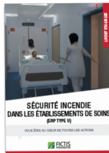
Livret «Sécurité incendie dans les établissements de soins»