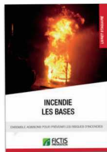
Livret «Incendie : Les bases»