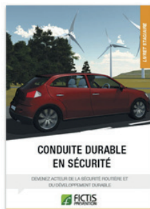
Livret Conduite durable en sécurité