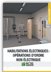
Livret habilitations électriques : opérations d'ordre non électrique