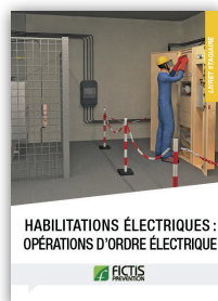
Livret habilitations électriques : opérations d'ordre électrique