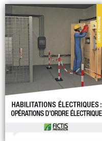
Livret habilitations électriques : opérations d'ordre électrique