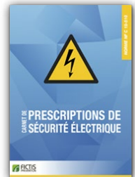
Carnet de prescription de sécurité électrique