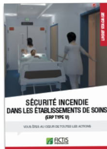
Livret «Sécurité incendie dans les établissements de soins»