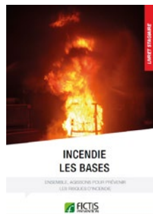
Livret «Incendie : les bases»