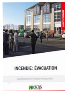
Livret «Incendie : Évacuation»