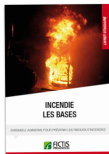
Livret « Incendie : les bases »