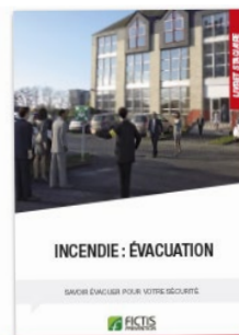
Livret « Incendie : évacuation »