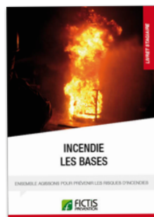
Livret « Incendie : les bases »