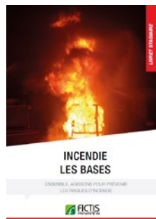
Livret «Incendie : les bases»