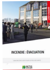
Livret «Incendie : Évacuation»