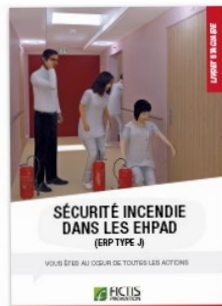
Livret « Sécurité incendie dans les EHPAD (ERP Type J) »